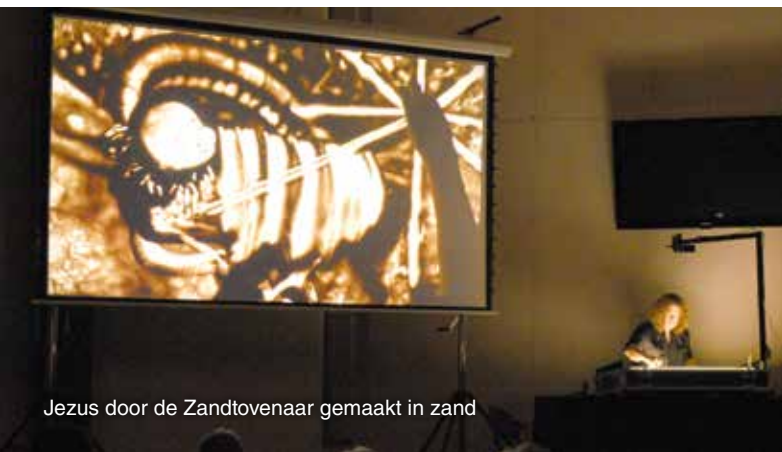
Jezus door de Zandtovenaar gemaakt in zand

De eerste steen is gelegd op 12 april 2017