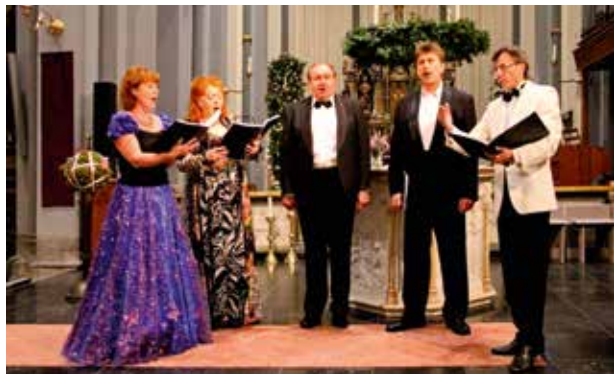
Neva Ensemble St.Petersburg Dinsdag 19 december H.Clemenskerk Nuenen

Als het Neva Ensemble uit St. Petersburg naar Nuenen komt, dan weten we dat het bijna Kerstmis is. Het Neva Ensemble komt al voor de 12 e keer en daarmee heeft het optreden van dit ensemble een vaste plaats veroverd in de agenda van heel veel mensen. Dit jaar komt het Neva Ensemble vlak voor Kerstmis, op dinsdag 19 december. Het programma is nog niet bekend, maar dat zal in principe weer uit drie delen bestaan. Beginnend met mooie Slavische Byzantijnse koormuziek voor de pauze en gevolgd door opgewekte Russische volksliederen afgewisseld met licht klassieke opera en operette- muziek. En omdat het bijna Kermis is zal het geheel afgewisseld worden met mooie kerstliederen. Natuurlijk is dit concert gratis toegankelijk, maar wij verwachten wel dat u na afloop van het concert uw waardering zult laten blijken door uw bijdrage aan hun collecte. Dat zal dan ook weer een aansporing zijn voor alle medewerkers van het Neva Ensemble om het volgende jaar weer terug te komen naar Nuenen. U bent van harte uitgenodigd op 19 december om 20.00 uur.